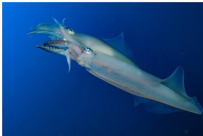
Accouplement de calamars veinés.