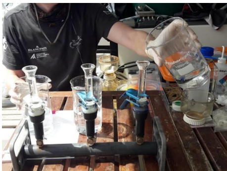
Filtration d'eau de mer prélevée en profondeur pour en étudier les bactéries.

Nos partenaires scientifiques : Andromède océanologie, Chorus à Grenoble, CEFE (UMR CNRS, Université de Montpellier, Montpellier Supagro, EPHE, INRA, IRD) à Montpellier, CSM à Monaco, ECLA (AFB, ONCFS, IRSTEA, USMB), IMBE (Aix Marseille Université, CNRS, IRD, Avignon Université), HE2B, le laboratoire commun InToSea à Montpellier, le laboratoire Arago à Banyuls-sur-mer (Observatoire océanologique de Banyuls-sur-Mer, CNRS, IRD, UPMC), MARBEC à Montpellier (UMR IRD, Université de Montpellier, Ifremer et CNRS), MIO (Université Aix-Marseille, Université de Toulon, CNRS, IRD) à Marseille, TETIS (AgroParisTech, CIRAD, IRSTEA, CNRS) à Montpellier, STARESO à Calvi, l'université libre de Bruxelles.